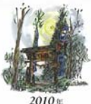
2010年 旧暦カレンダー 宮城県種まき村の住居神楽